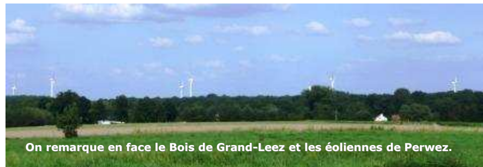
On remarque en face le Bois de Grand-Leez et les éoliennes de Perwez.

Chemin faisant dans la rue Follée, on peut voir à droite un alignement de saules blancs. Ces arbres remarquables sont situés à l'arrière du N°13 de la rue de Perwez.