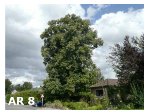
N°11: Tilleul à petites feuilles - Tilla cordata (Au n° 22 de la rue de Perwez)

Trois sujets en prairie. Le chêne pédoncule se trouve partout en Europe jusqu'au Caucase sauf en région méditerranéenne. Peut vivre jusqu'à 1000 ans et plus. Sa couronne est formée par des branches sinueuses, lourdes et étalées. Ses fruits, les glands, sont souvent groupés par deux sur un pédoncule de 5 à 12 cm.