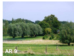
N°8: Saule blanc - Salix alba

Chemin faisant dans la rue Follée, on peut voir à droite un alignement de saules blancs. Ces arbres remarquables sont situés à l'arrière du N°13 de la rue de Perwez.