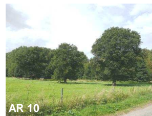
N°10: Chêne pédonculé - Quercus robur (quelques mètres avant le carrefour)

En cours de route, nous remarquons de nombreux saules têtards ce qui témoigne de terrains humides.