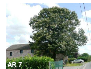
N°9: Tilleul à petites feuilles - Tilla cordata (Au N° 40 de la rue Follée.)

Le tilleul à petites feuilles possède des feuilles d'environ 8 X 8 cm en forme de cœur alors que pour le tilleul à grandes feuilles a des feuilles jusqu'à 15 X 15 cm. Les feuilles du tilleul à petites feuilles sont planes, glabres excepté quelques touffes de poils roussâtres dessous à l'angle des nervures, le revers est mat et légèrement argenté.